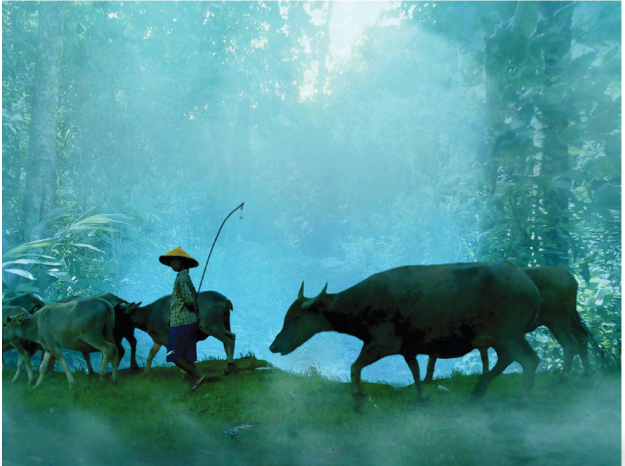
Bumi Tuwo / Indonesia

나는 가지 않으리 별이 쏟아진다는 히말라야로 천지를 뒤흔든다는 나이아가라로 나는 이곳에 남으리 한 무리 소 떼가 나를 깨우는 곳 숲을 지나는 바람과 마주 인사하는 곳 하루가 하루를 열어 오래 걸었어도 늙지 않는 이 길에 내 삶의 발자취를 이곳에 묻으리 멀고 먼 성지를 돌아온 순례자처럼