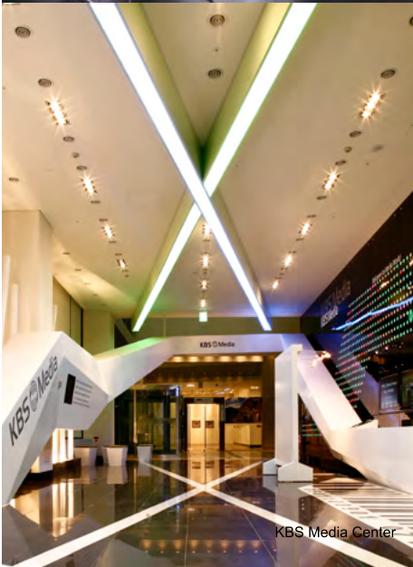
KBS Media Center