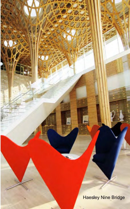
Haesley Nine Bridge