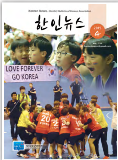
제15회 아시아여자 핸드볼대회 결승전(3월23일)