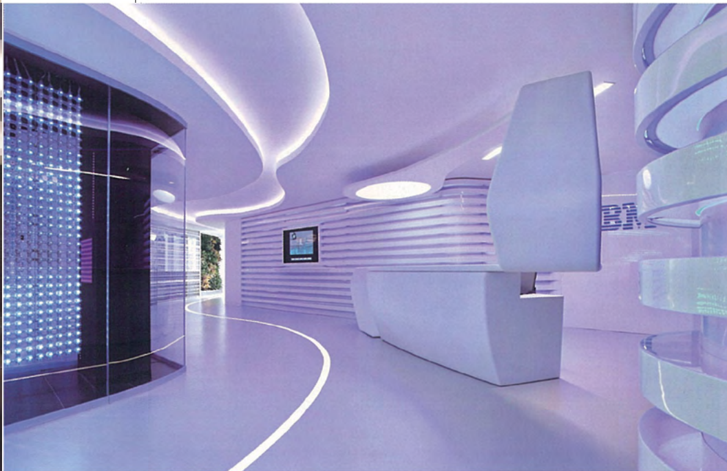
The reception area:the sailing-boat-like reception desk visualises the value-thinking IBM lives by.